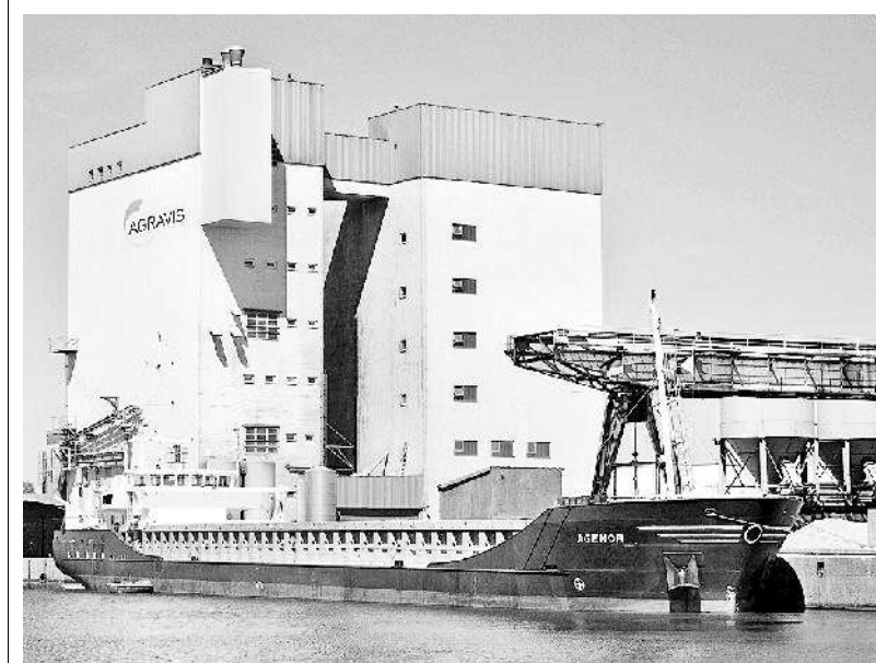
Agravis-Silo in Bremerhaven: So gut wie im vergangenen Jahr geht es dem Agrar-Konzern längst nicht mehr.

Verwandte Marktteilnehmer wie der Düngemittelhersteller K + S enttäuschten allerdings trotz Rekordergebnis mit ihrem Ausblick für 2009. Wettbewerber Baywa wird seinen Jahresabschluss für 2008 erst Ende März vorstellen. Doch bereits nach dem vorletzten Quartal lagen die Münchner mit einem Umsatzplus von 27 Prozent ebenfalls auf Rekordkurs.